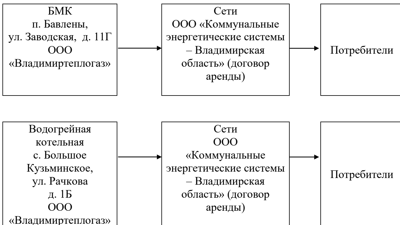
Рисунок № 1

Схема теплоснабжения Бавленского поселения от источников тепла представлена на рисунке № 1