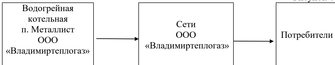
Рисунок № 1

Водогрейная котельная Флорищинского поселения, находится на обслуживании ООО «Владимиртеплогаз». В качестве основного топлива на котельной используется природный газ. Отопительный период длится 213 суток. На водогрейной котельной п. Металлист не предусмотрена круглогодичная выработка тепловой энергии на горячее водоснабжение потребителей.