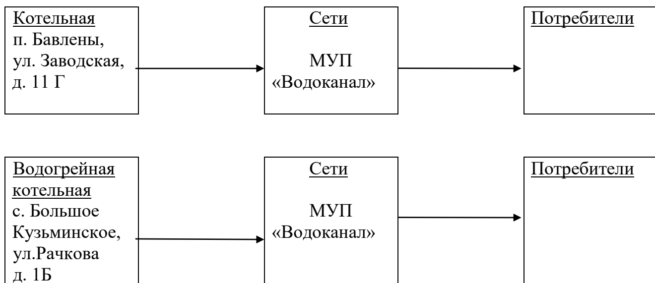
Рисунок № 1

В связи с тем, что в Бавленском сельском поселении эксплуатация источников теплоснабжения и присоединённых тепловых сетей осуществляется разными юридическими лицами, необходимо предусмотреть согласованность действий между оперативным и эксплуатационным персоналом данных предприятий, в т.ч. за счёт принятия единых внутренних регламентов и инструкций.