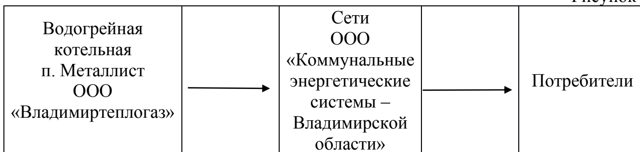
Рисунок № 1

Водогрейная котельная Флорищинского поселения, находится на обслуживании ООО «Владимиртеплогаз». В качестве основного топлива на котельной используется природный газ. Отопительный период длится 213 суток. На водогрейной котельной п. Металлист не предусмотрена круглогодичная выработка тепловой энергии на горячее водоснабжение потребителей.